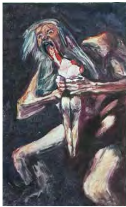
D'après Goya, monotype