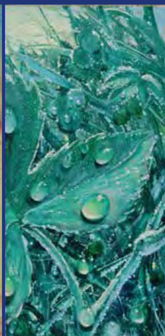
André Dhôtel Comment Fabien regarda l'Aurore (Glancier Guénaud 1982)