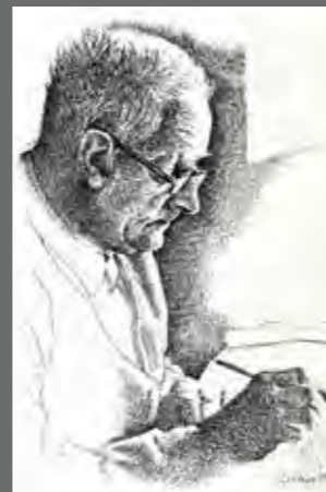
Portrait de Jean Giono