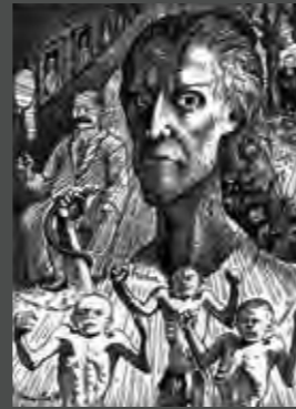
Vipère aux poings