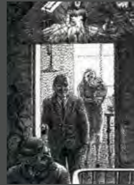
La mort du petit cheval