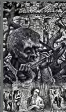
Un dte Beaumugne

laisse de profondes séquelles ; si l'on y superpose de surcroît une petite enfance chaotique, cela explique que cette propension naturelle à m'émerveiller et ma bonne vitalité doivent encore cohabiter avec un fond de grande mélancolie.