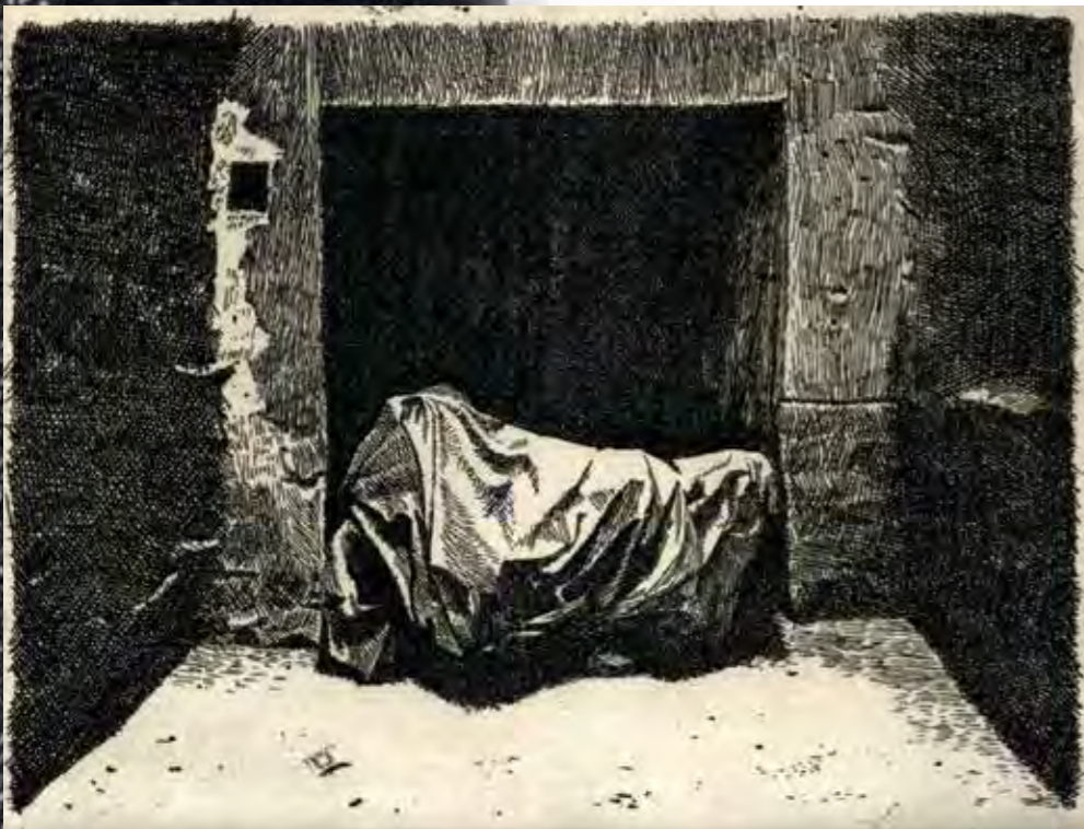
La moto, eau-forte, 1974