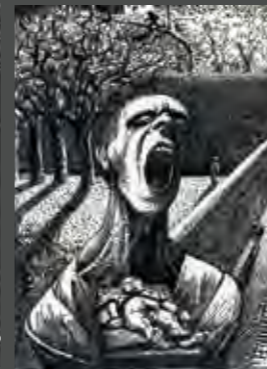
La tête contre les murs