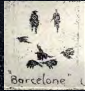
En transit, eau-forte, 1974