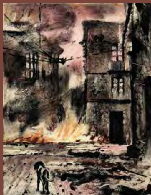
André Malraux, L'Espoir (Gallimard 1978)