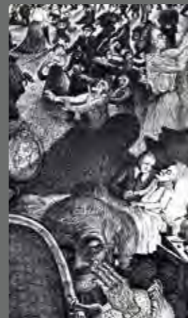
Mort d'un personnage