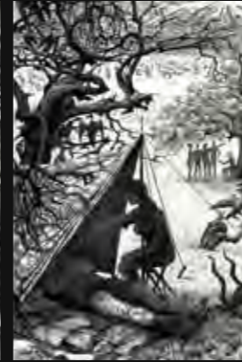
Les neiges du Kilimandjaro