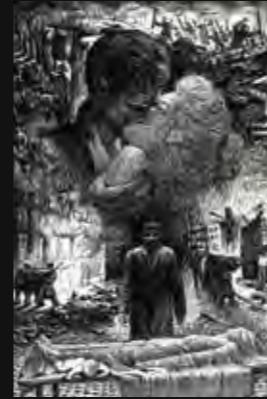
L'adieu aux armes