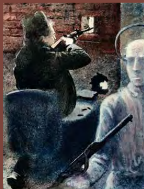
André Malraux, L'Espoir (Gallimard 1979)