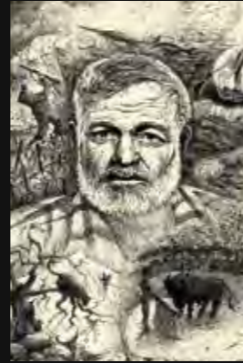
Portrait d'Ernest Hemingway