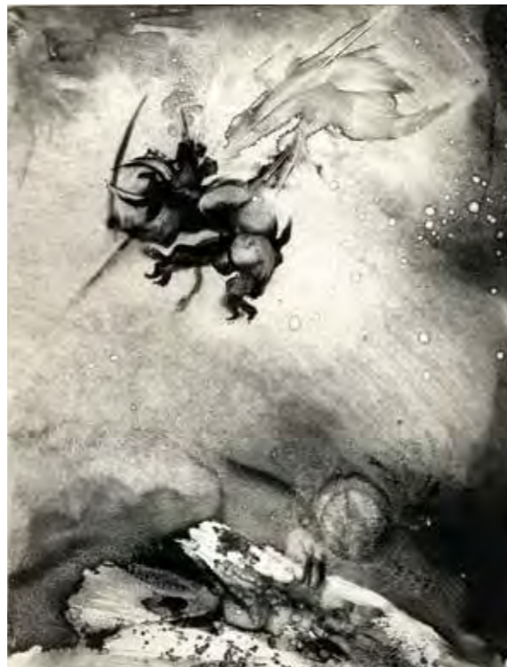
L'ange et le Minotaure , monotype

En rassemblant, triant, encadrant les œuvres pour la médiathèque Ludovic Massé, nous avons constaté que l'ensemble était plutôt sombre. Mon séjour mouvementé dans l'Espagne Franquiste en est pour une part responsable, mais pas seulement. Naitre en 1943